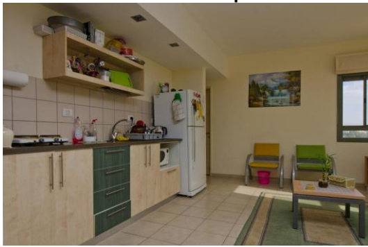
מטבח דירה-מתחם מצדה