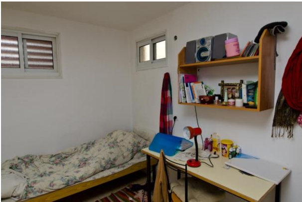
חדר מגורים – מתחם מגורים