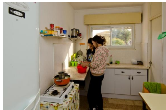
מטבח בדירה – מתחם טרומים