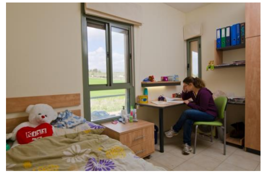
חדר דירה-מתחם מצדה