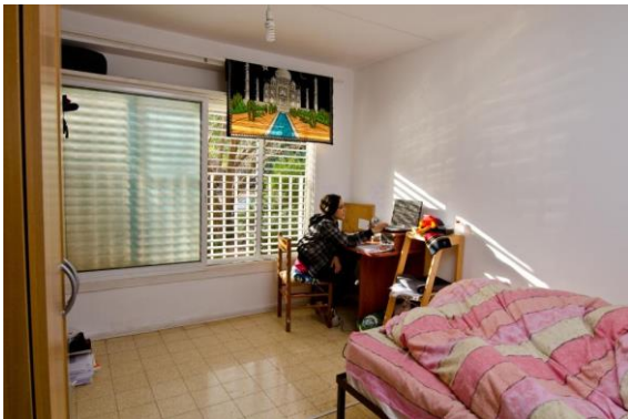
חדר מגורים מתחם הלבנון 11

במעונות הלבנון 11 קיים חדר כביסה העומד לרשות כלל הסטודנטים