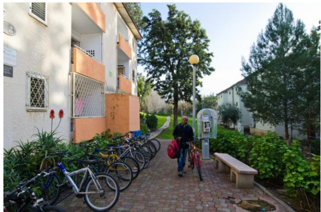
מבנה – מתחם עין זהב