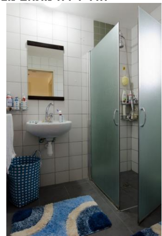
מקלחת דירה-מתחם מצדה