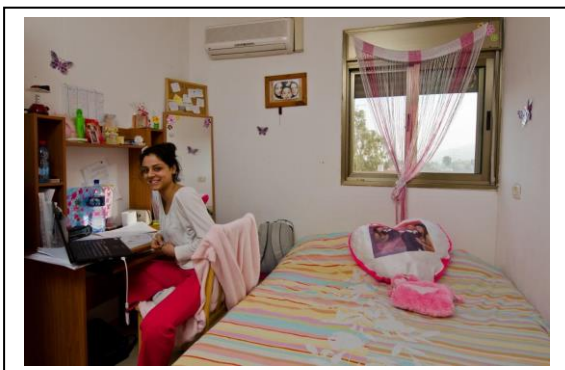
חדר מגורים מתחם הלבנון 11