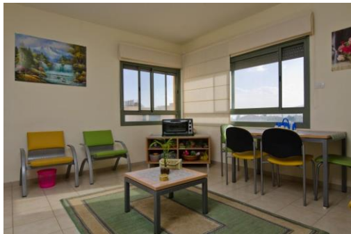
סלון דירה-מתחם מצדה