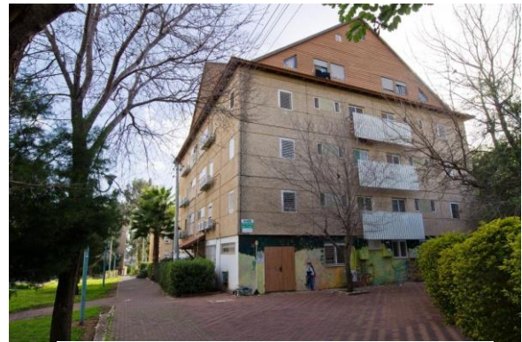
מבנה מתחם הלבנון 11