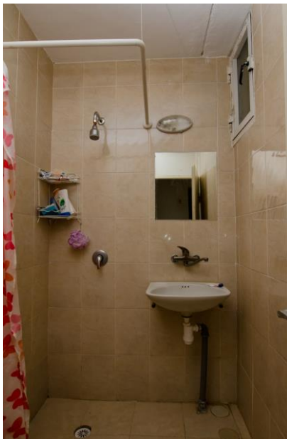
מקלחת בדירה-מתחם טרומים