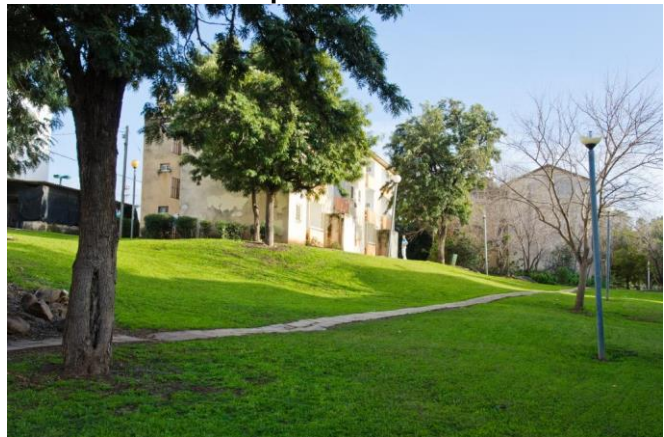
מתחם עין זהב