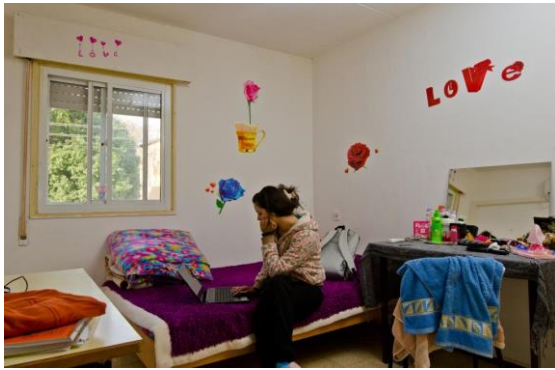
חדר מגורים – מתחם טרומים