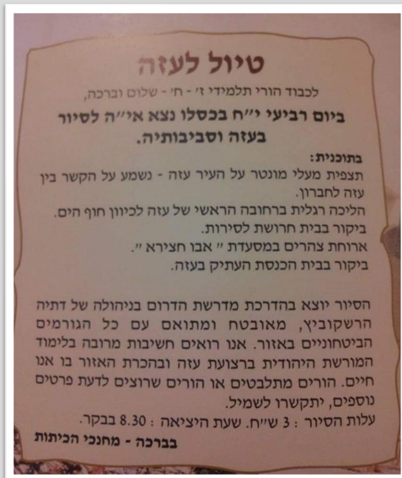
הודעה להורי ילדי בית ספר נווה דקלים (גוש קטיף), 1987