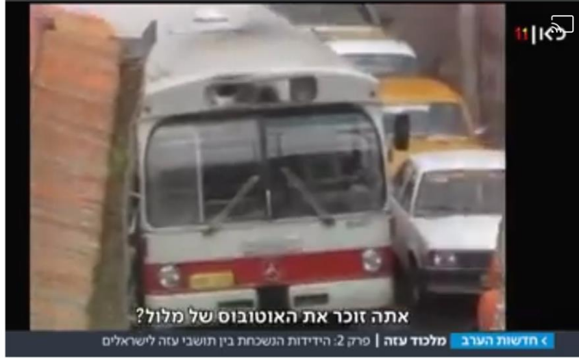
(תמונה מתוך הסידרה "מלכוד עזה", כאן 11 פרק 2)

"האינתיפאדה ששברה חלומות": מסעדות הדגים, הטיולים על החוף והמפגשים המשותפים - כך נראתה הידידות הנשכחת בין תושבי עזה לישראלים #מלכוד_עזה פרק 2 Vico Atoaan