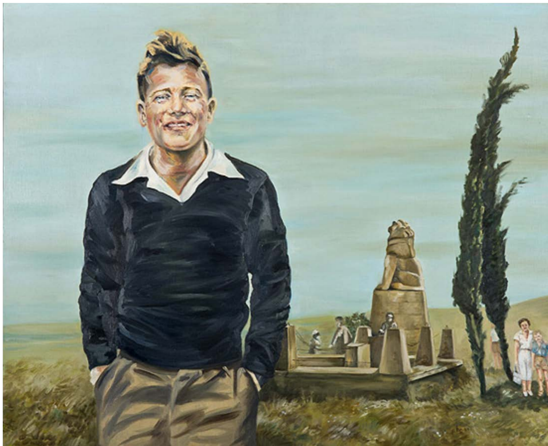
”שמיר בתל-חי” - ציור משנת 2009 שמן על בד 80/100 ס”מ

בעקבות שילוב של שני צילומים, מספרת הציירת: