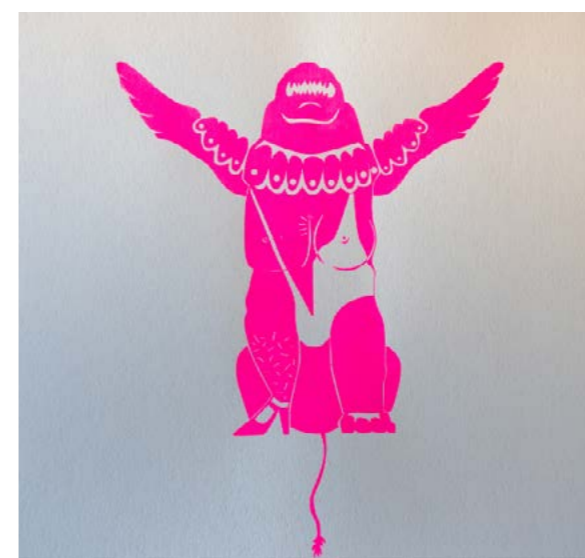
פרח אריה הלהט"ב הדפס דשת בשישה צבעים על נייר 70*70 ס"מ (ממוסגר)

בהשראת גיבורי העל במשחקי ילדים, יוצרת האמנית "משחק הרכבה" של האריה השואג, כאמצעי להעביר את סיפור תל חי לדור הצעיר.