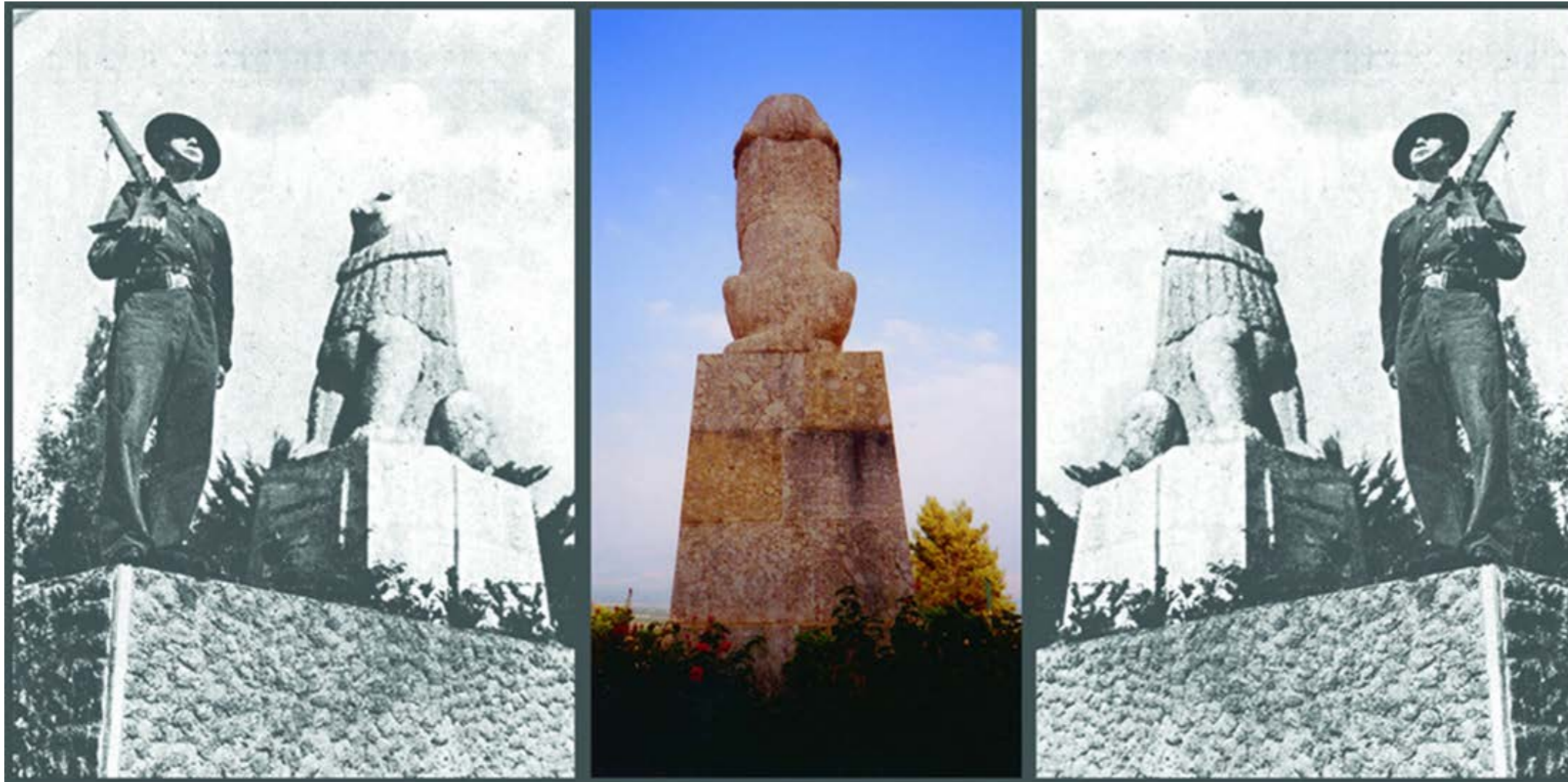
"שאגו בחורים" צילום

טריפטית צילומי שהוצג לראשונה בשנת 2005, בגלריה נלי אמן בתל אביב.