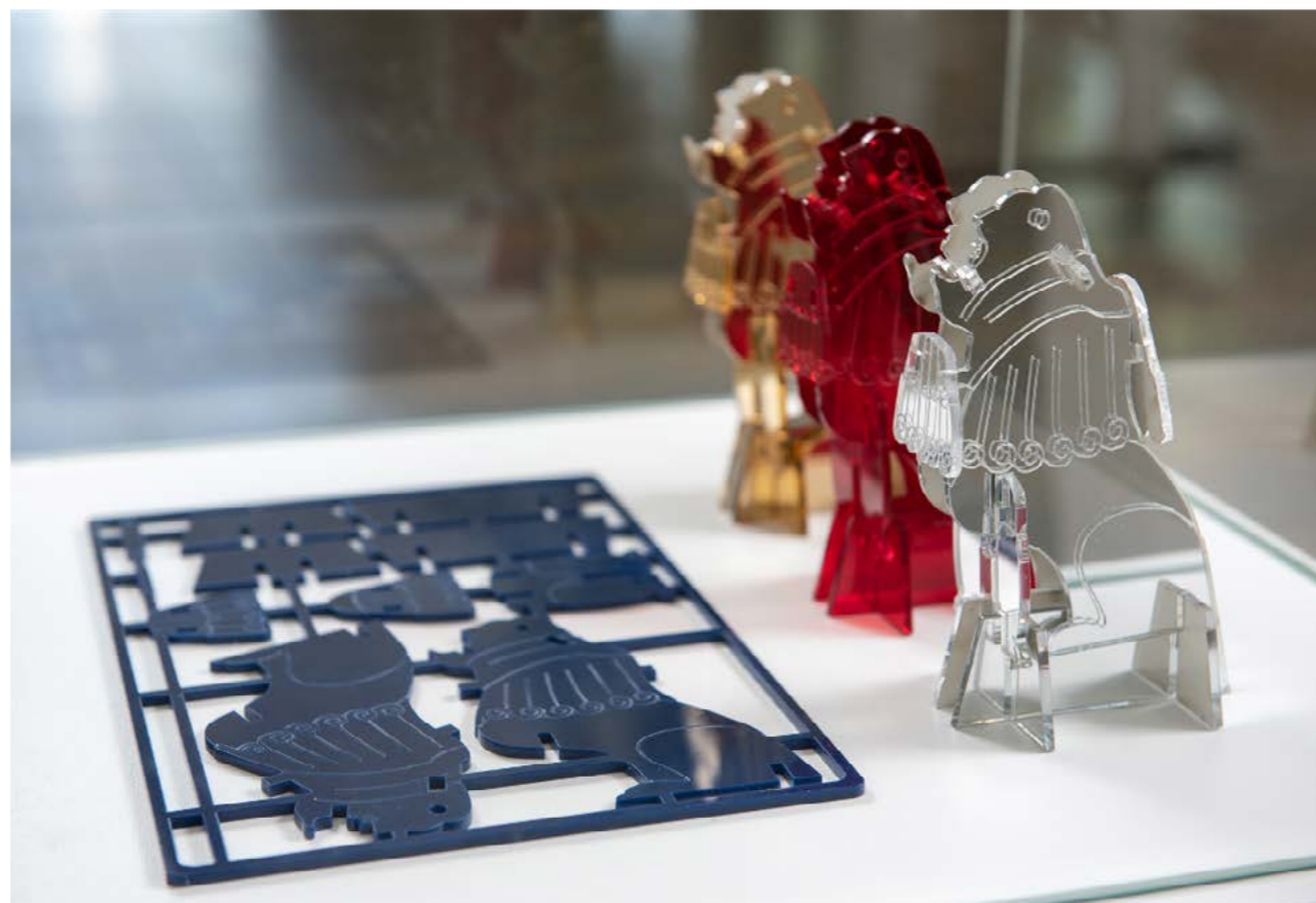
חיתוך לייזר של פרספקס

בהשראת גיבורי העל במשחקי ילדים, יוצרת האמנית "משחק הרכבה" של האריה השואג, כאמצעי להעביר את סיפור תל חי לדור הצעיר.