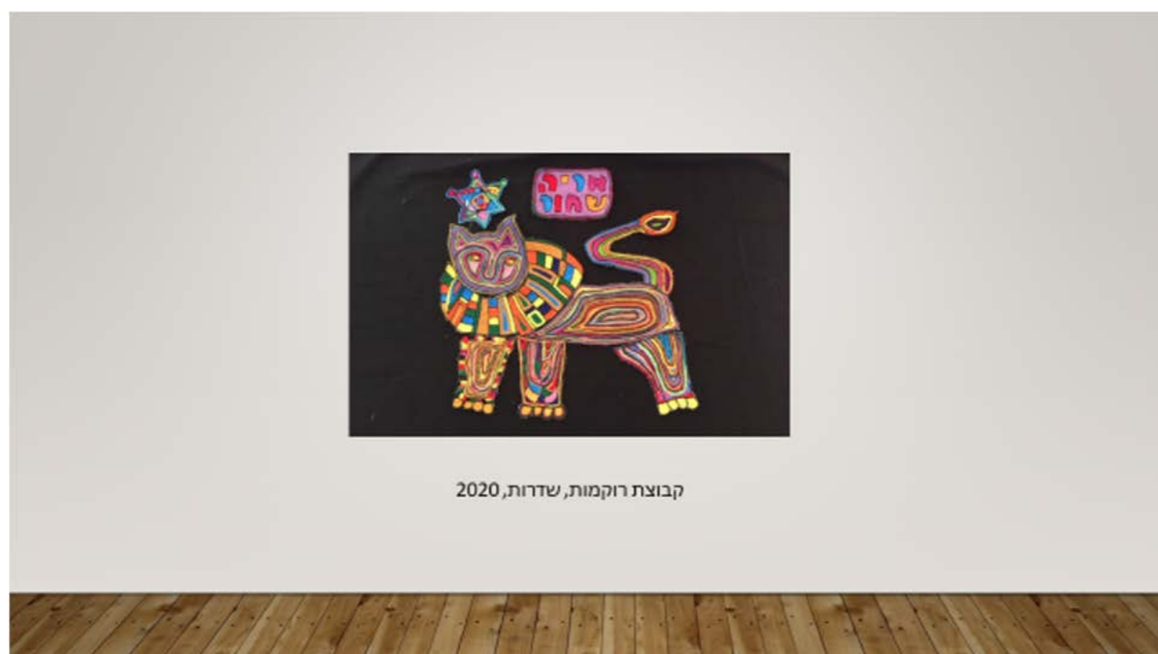
קבוצת רוקמות, שדרות, 2020

הדוקמות הן נשים יוצאות אתיופיה החיות בשדרות. הנשים יוצרות יחד אמנות מסורתית בעבודת יד הנושאת סיפור וטעם אישי. לכבוד התערוכה יצרו האמניות רקמה אתיופית מדהיבה ואותנטית המציגה את דימוי האריה המהווה את אחד מסמלי קיסר אתיופיה. דימוי האריה שהופיע על דגל האימפריה האתיופית וכן על בולים ומטבעות, מוצג בתערוכה בהקשר של המרקם החברתי בישראל של עכשיו לצד פסל האבן כסמל תרבות - "טוב למות בעד ארצנו".