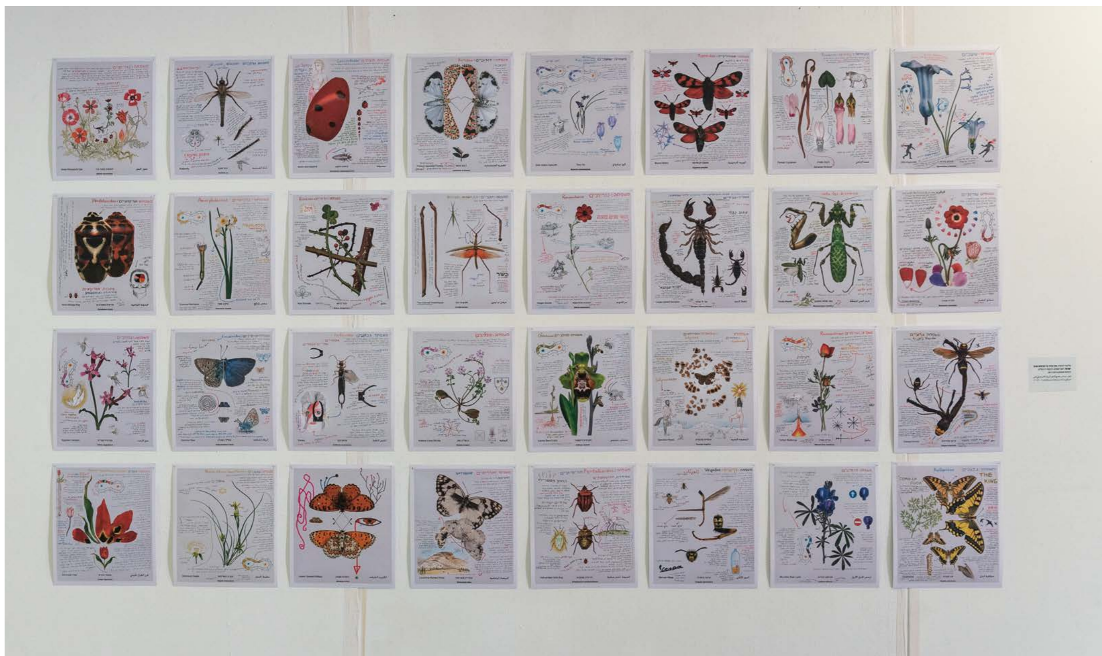
”אגד פרחי בר וחרקים בארץ ישראל”

על מקומו של הטבע בחייו הוא מספר: ”בגיל עשר עברנו מהשיכונים הצפופים של שכונת שפרינצק בחיפה לבית מבודד ורחוק בסוף שכונת דניה. לא היו שם שכנים או חברים, רק הרי טרשים: ירוקים ומלבלבים בחורף, יבשים וקוצניים בקיץ. ברשותי היה רק ידע מדעי בסיסי והספרות הטקסונומית היבשה לא עניינה אותי. מבחינתי, לא היה תחליף למגע הקרוב עם עקרב שחור בצנצנת, עם בצבוצו של צבעוני יחיד מתוך סבך, או עם ניחוח אדמה אחרי הגשם, מתובל בריח נרקיסים, קורנית בר ואלת המסטיק. את כל אלה, שהיו כמו שכני החדשים, אי אפשר לבטא בשום ספר, מגדיר או אגד.